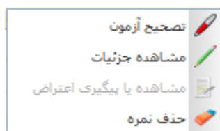
شکل ۱-۵- کلیک راست در لیست نمرات

اگر بر روی هر ردیف از این لیست راست کلیک کنید (شکل ۱-۵) امکاناتی در اختیار شما قرار می‌گیرد.